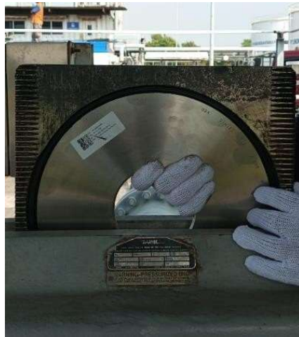
Gambar 2. Penggantian Daniel Senior Orifice

Penggunaan Daniel senior orifice ini juga suatu fungsi untuk mempermudah pelaksanaan kalibrasi oleh plate orifice tersebut, karena dapat dilakukan diluar pipa, karena proses pelapasan orifice ini memungkinkan kalibrasi plate diluar proses laju aliran