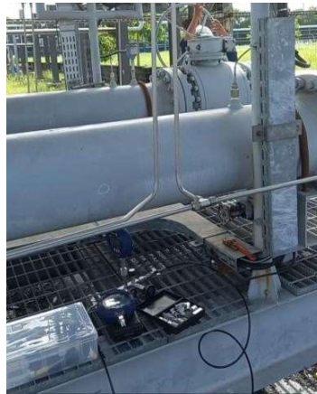
Gambar 4. Validasi Bulanan Metering System

Setiap peralatan pada metering memiliki troubleshooting yang akan dikaji oleh setiap perusahaan, karena ini hasilnya akan menjadi bahan evaluasi. Pada PT ENP terdapat Daniel Senior Orifice yang tersedia 2 chamber sehingga tidak perlu menghentikan proses ataupun mengganggu jalannya proses. Dengan keadaan ini juga memperluas nilai evaluasi atau kegiatan yang akan mendukung evaluasi seperti dengan yang dilakukan PT Energi Nusantara Perkasa dengan melakukan validasi bulanan.